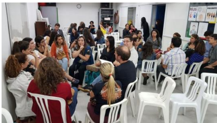
Como Nasce um Projeto?

Em breve daremos mais notícias para quem quiser esquentar os tambores para o concurso do samba de 2019.