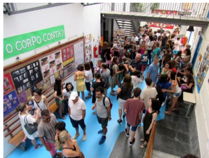
Aconteceu na Feira Moderna

Parabenizamos estudantes e toda a equipe docente pelo excelente evento, resultado do diálogo, da cooperação e da participação de todos num projeto comum.