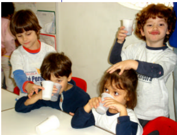
O caldinho do feijão que o Informe 525 prometeu que ia ser devolvido