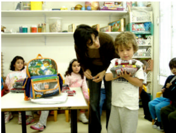
Turma da Neve e as cores e sabores das frutas