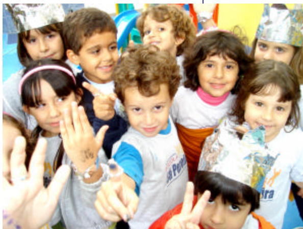
Turma do Oceano criando e recriando

As ilustrações poderão ser apreciadas na Festa Pedagógica.