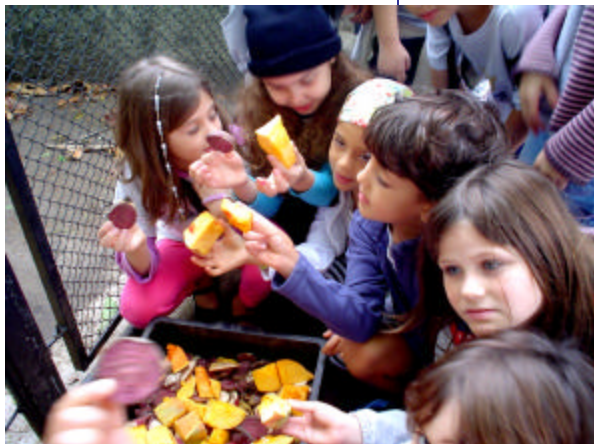
F2M no Jardim Zoológico

Na próxima semana as fotos do passeio estarão disponíveis no nosso site.