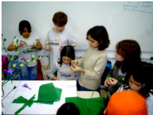
F3T se prepara para a Feira Moderna