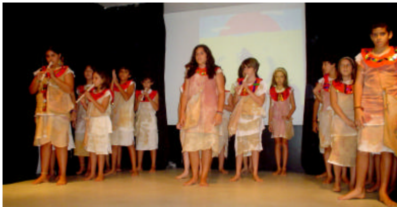
F5M na Terra Prometida

Numa manhã nublada, com cara de que ia chover, a F2M foi ao Jardim Zoológico. Chegando lá tínhamos o objetivo de achar alguns animais moradores da região montanhosa dos Andes. Para nossa surpresa, encontramos o condor, alpacas e lhamas. Demos sorte! Vimos um "bebê alpaca" mamando vorazmente na