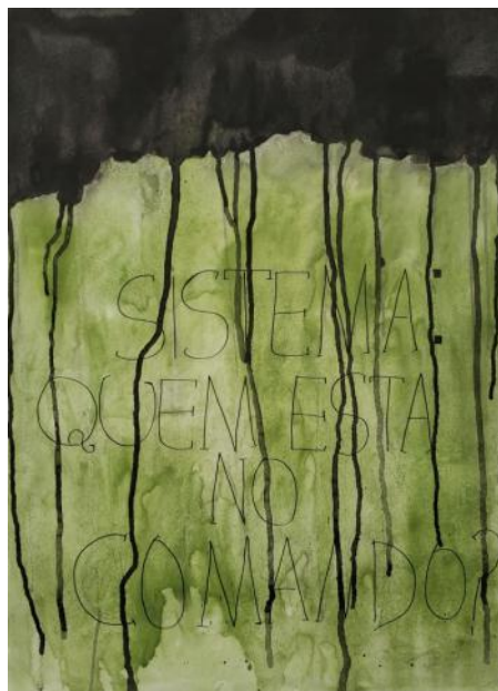
Sistema: Quem Está no Controle?

roteiro MURILO DE LUCENA | direção JUAN PEREZ | produção MARIA CLARA SCHWERDTNER e FLORA BUZZATTI | direção de fotografia FLORA BUZZATTI | som RAFAEL MARTINS e HENRIQUE GOMES | direção de arte RAFAEL MARTINS e YASMIM MATOS | figurino e maquiagem YASMIM MATOS | continuidade MARIA CLARA SCHWERDTNER | edição HENRIQUE GOMES e MURILO DE LUCENA.