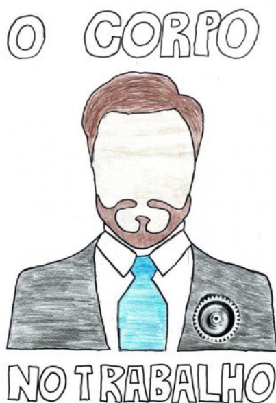
O Corpo no Trabalho