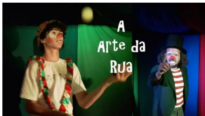
A Arte da Rua