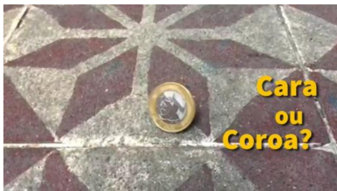
Cara ou Coroa