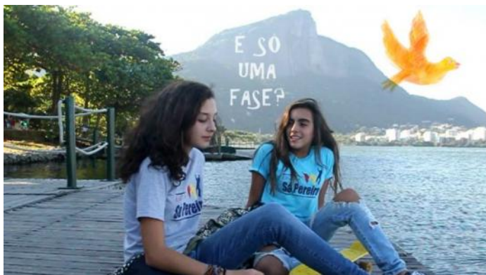
É Só uma Fase?